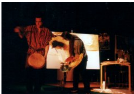
Happening peinture musique : la scène